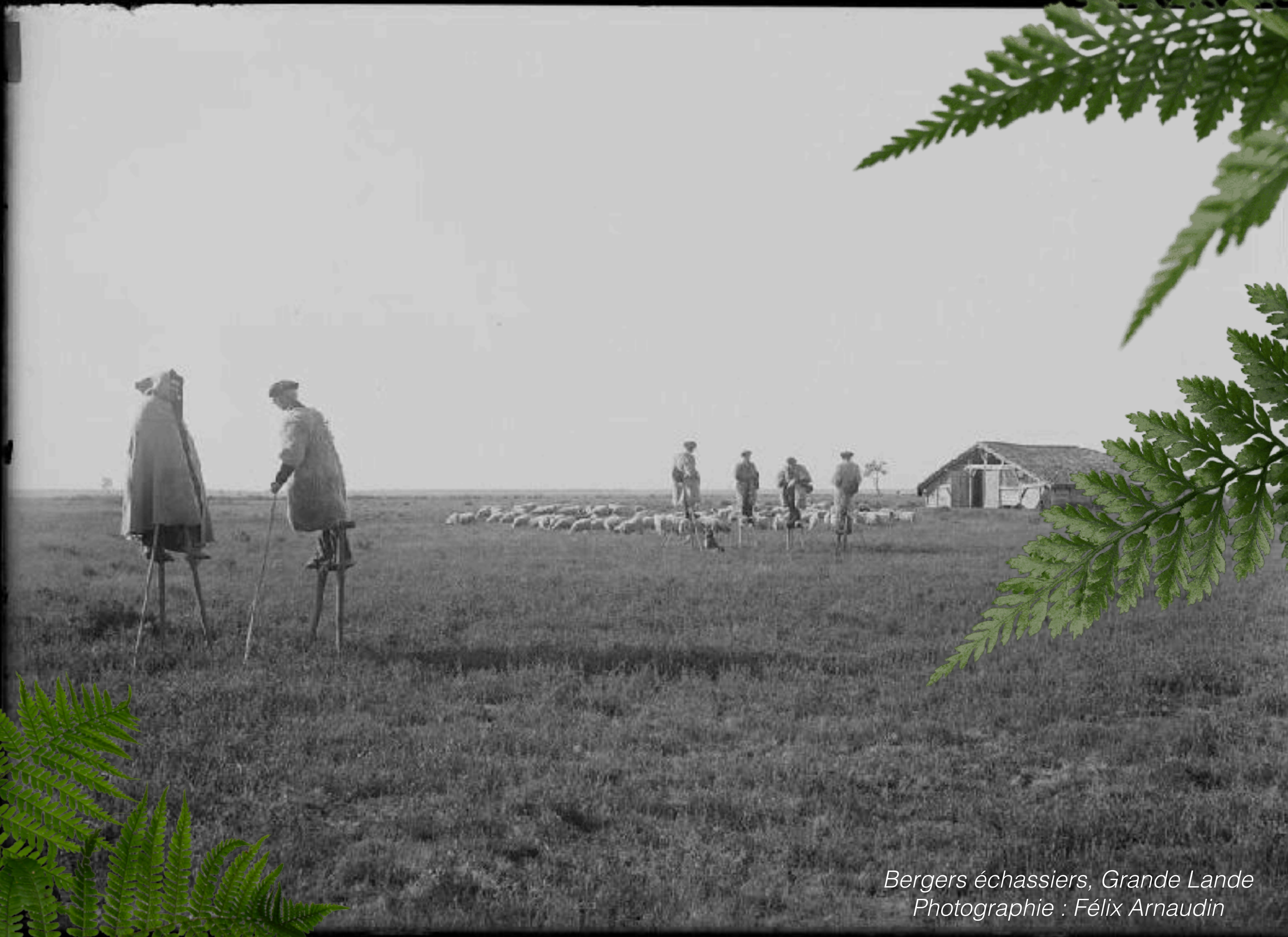
Bergers échassiers, Grande Lande Photographie : Félix Arnaudin