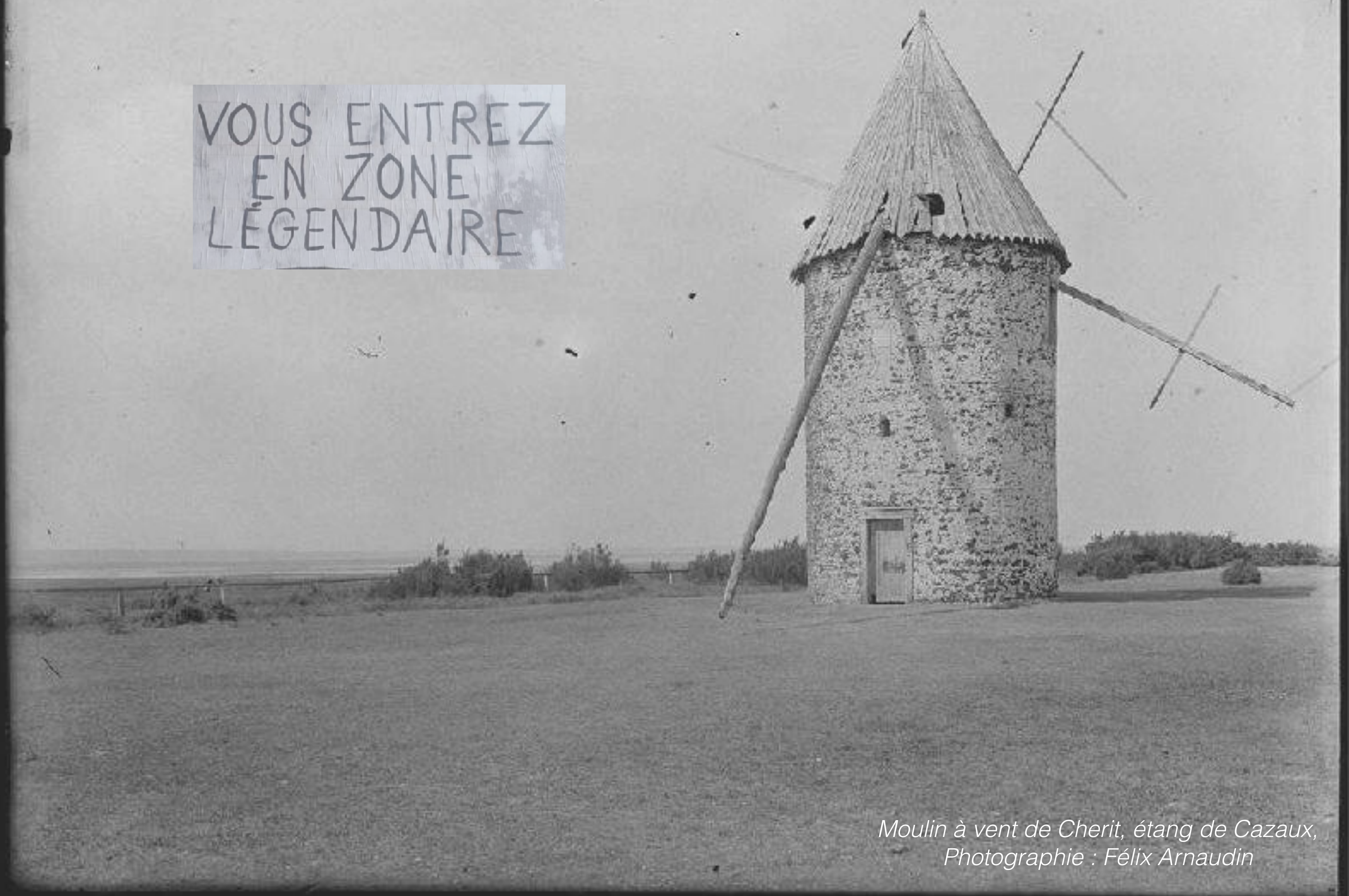
Moulin à vent de Cherit, étang de Cazaux, Photographie : Félix Arnaudin